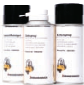
Winteraanbiedingen Veilig en comfortabel