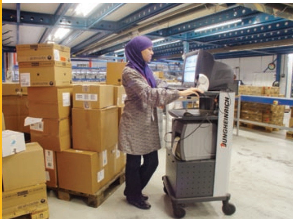
De mobiele werkplek van Jungheinrich: flexibiliteit op de werkvloer

Als een van de eerste bedrijven in Nederland schafte Pluripharm uit Alkmaar de mobiele pc-, of terminal werkplek van Jungheinrich aan. Een aanschaf die het invoeren van logistieke data aanmerkelijk vereenvoudigde.