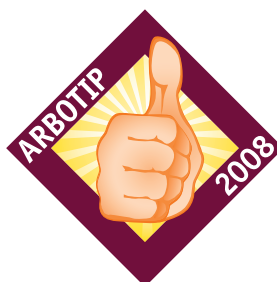
Arbotip Prijs voor JetPilot stuur