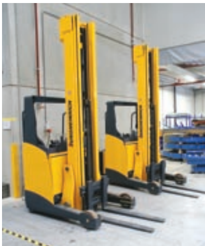
De nieuwe reachtrucks zijn voorzien van camera en monitor om ook tot 8,5 meter hefhoogte altijd zo veilig mogelijk te kunnen werken

Een optimale logistiek is voor Kramp Varsseveld van levensbelang. De groothandel in technische en agrarische producten biedt haar afnemers de keuze uit meer dan 150.000 verschillende artikelen. De kracht van Kramp zit in de snelheid van leveren volgens het ‘one-stop-shop’ principe. Tot laat