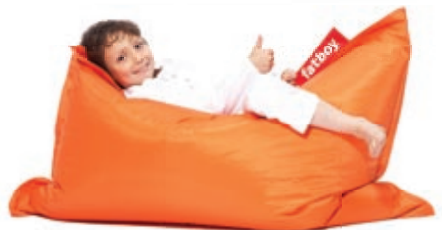
Regisseurrol Fatboy zit goed in nieuw dc